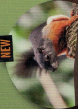
ÉCUREUIL DE PREVOST