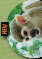
SAÏMIRI DU PÉROU

UN PARC UNIQUE EN EUROPE, SPECIALISE SUR LES ESPECES MENACEES