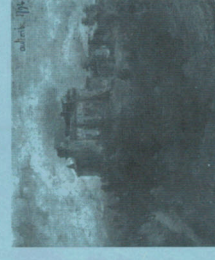
Aulteribe in 1794

Het kasteel van Aulteribe werd in de tweede helft van de XIVde eeuw gebouwd. Het wordt rond 1450 eigendom van de heren van La Fayette en vervolgens van de familie Beaufort Montboissier Canilhac.