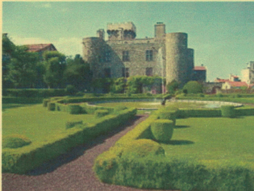
Chateau d'Opme in de Auvergne

Het Château d'Opme (uitgesproken als 'ome') is een 11e-eeuws kasteel, later omgezet in een elegant kasteel , gelegen in de gemeente Romagnat , in het departement van Puy-de-Dôme in de Auvergne regio van Frankrijk, negen kilometer ten zuiden van Clermont-Ferrand . Zowel het kasteel en de tuin worden geclassificeerd als historische monumenten door het Franse Ministerie van Cultuur : de tuinen zijn geclassificeerd als een jardin remarquable (Opmerkelijke Tuinen van Frankrijk).