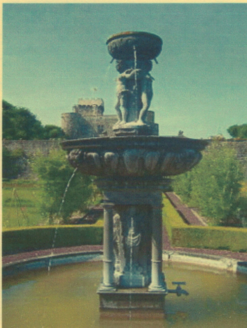
Fontein van het Chateau d'Opme (1617) toegeschreven aan Jean Androuet de Cerceau

Het oorspronkelijke kasteel werd gebouwd op het einde van de 11e eeuw, waardoor het een van de oudste kastelen in de Auvergne is. Het was eigendom van de graven, en dan de Dauphins, van de Auvergne, en bewaakt een passie liep door de oude Romeinse weg liep van Clermont naar Puy-en-Velay . Zijn naam kwam van het Latijnse woord Oppidum van de Gallo-Romeinse heuveltopvesting steden van de regio. Het eerste kasteel had een binnenhof omringd door vijf torens, waarvan er drie stil te staan. In de 12e eeuw houden is een van de hoektorens vervangen